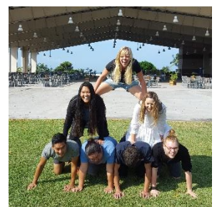
Foto 4, Mijn team

We zijn in totaal met z'n zevenen, inclusief mijn leiders. Iedereen is Amerikaans, behalve ik. Ik zit hierdoor wel gelijk goed in de Amerikaanse cultuur, maar ik merk ook dat ik het soms wel lastig vind. Zo hebben ze bv andere gewoonten en gebruiken, waarmee ik als Nederlander niet bekend ben. Ook is Engels hun moedertaal en ondanks dat ik ze prima kan verstaan is het toch anders wanneer Engels niet je moeder/hartstaal is. Verder zijn de meeste uit mijn team best wel jong en hebben ze weinig ervaring in het samenleven met een internationaal iemand. Dus is het voor hen (en mij) een goede oefening voor als straks de internationale studenten komen.