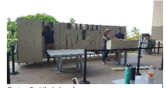
Foto 6, Kluisjes bouwen

Verder dienen we op maandag-, dinsdag- en donderdagochtend de basis. De afgelopen weken hebben we kluisjes gebouwd die gebruikt gaan worden in de keuken van de basis. Vrijwilligers van de keuken kunnen daarin hun spullen bewaren.