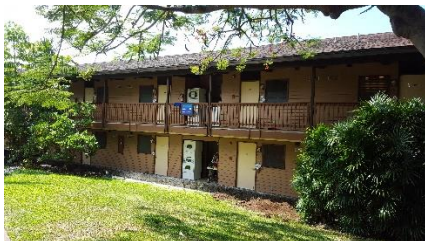
Foto 1, mijn appartement

Ik slaap hier op een kamer voor 8 personen, maar op dit moment deel ik de kamer met 4 andere internationale meiden die hier studeren. Ik kan goed met ze overweg, maar zie ze nauwelijks omdat ze erg druk zijn met hun studie.