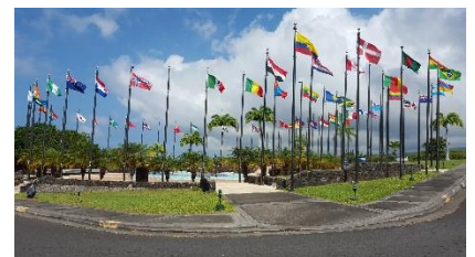
Foto 3, alle nationaliteiten die hier vertegenwoordigd zijn (ong. 50)