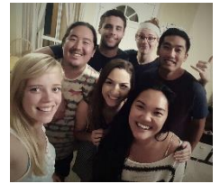
Foto 5, Selfie

Gelukkig merk ik dat we steeds beter elkaar leren kennen, begrijpen en zien en worden we steeds meer een team. 😊