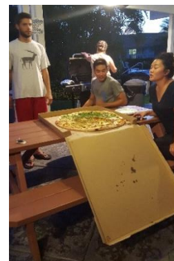
Foto 8, Bizar grote pizza

Verder heb ik 1 keer in de week een one on one met mijn leider; waarbij ik lekker even met haar kan spuien over van alles en nog wat en waarbij ze mij uitdaagt in mijn groeiproces. De weekenden zijn officieel vrij, maar dat komt maar weinig voor;) Vaak wordt alsnog een gedeelte van het weekend gevuld met ministry, vergaderingen of andere verplichten.