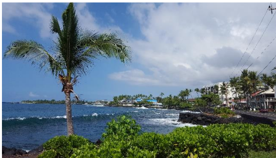
Foto 9, Kona