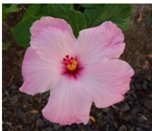
Foto 11, roze hibiscus