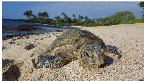
Foto 12, je moet hier oppassen dat je niet over een schildpad struikel..